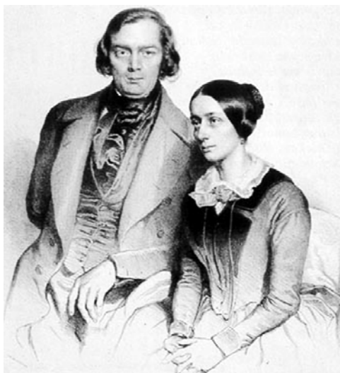
1848年のシューマン夫妻 左：ロベルト、右：クララ