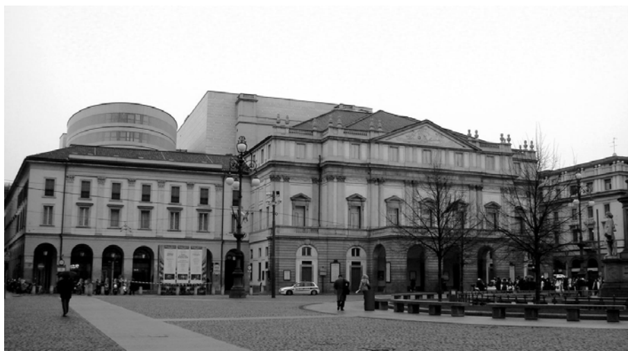
ミラノのオペラの殿堂スカラ座