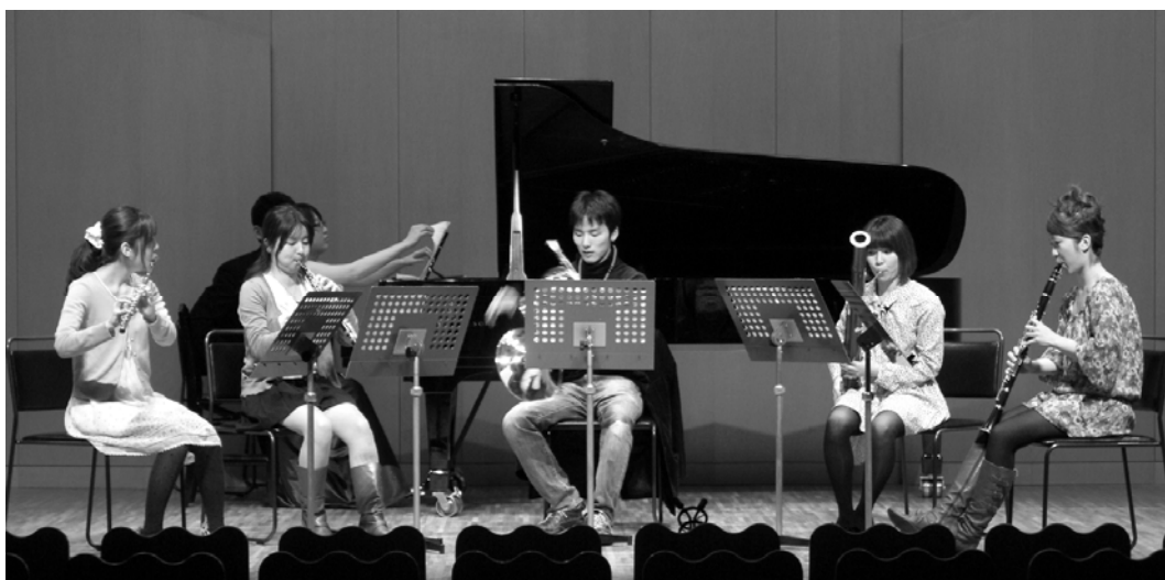
4月8日開催の[Fresh Concert CMDJ2011] 本番前のリハーサル風景

発行 日本音楽舞踊会議 The Conference of Music and Dance Japan