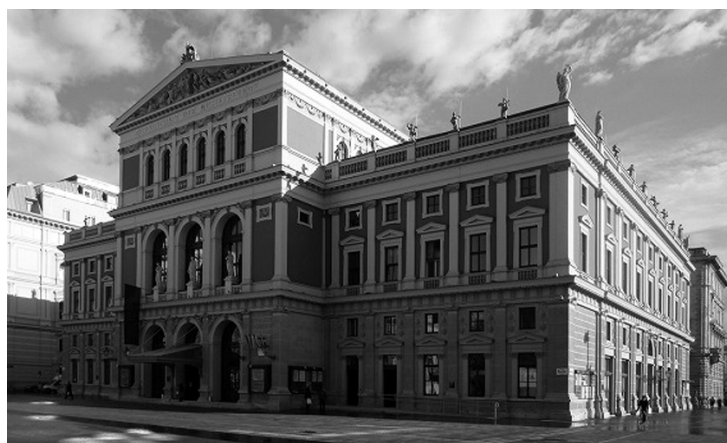
ウィーン楽友協会大ホール