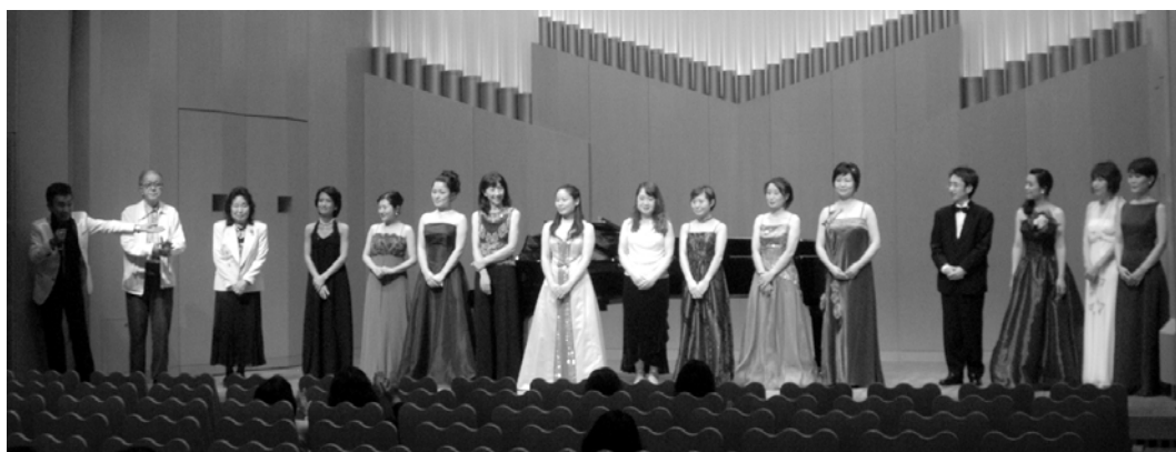
11月12日に公演された「若い翼によるCMDJコンサート」終演後の挨拶

発行 日本音楽舞踊会議 The Conference of Music and Dance Japan