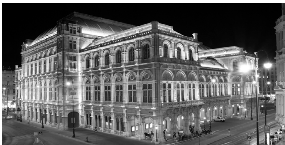
夜のウィーン国立歌劇場