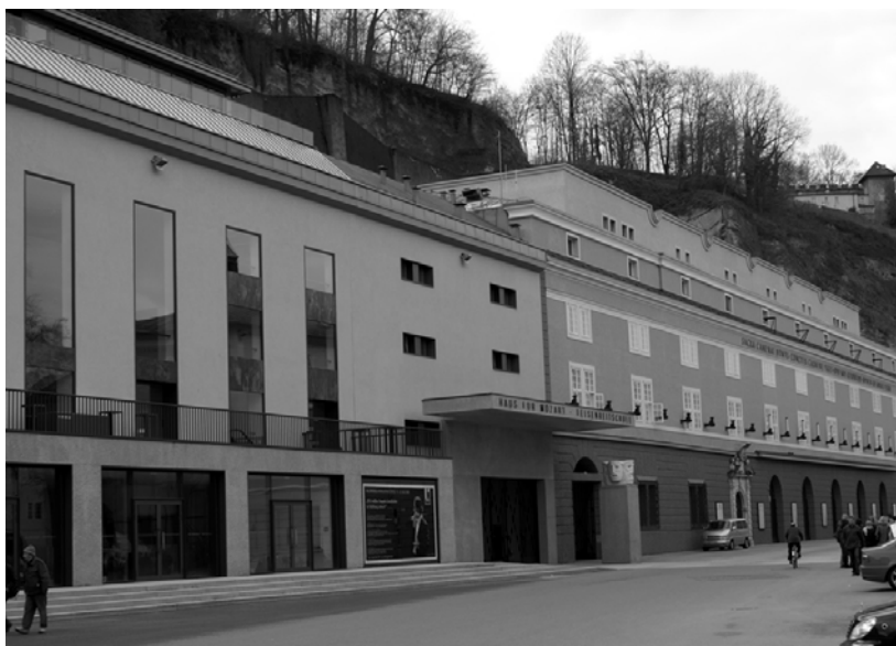
ザルツブルク 祝祭大劇場