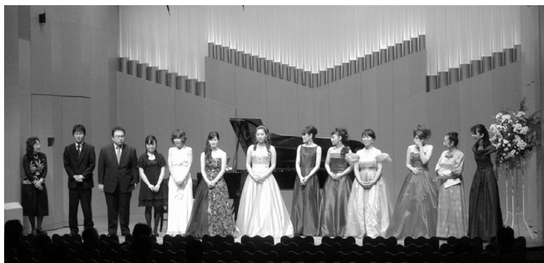
若い翼によるCMDJコンサート5 終演後の挨拶 (11月18日)