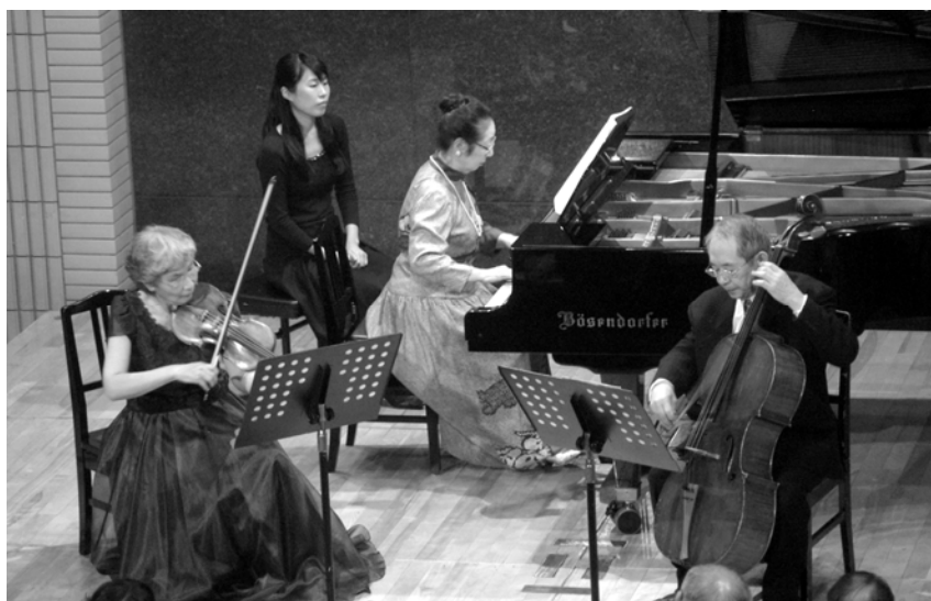
「ピアノと室内楽の夕べ」より(2012年12月4日 音楽の友ホール)