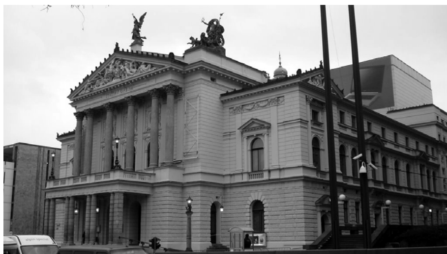
プラハ国立歌劇場 (チェコ)