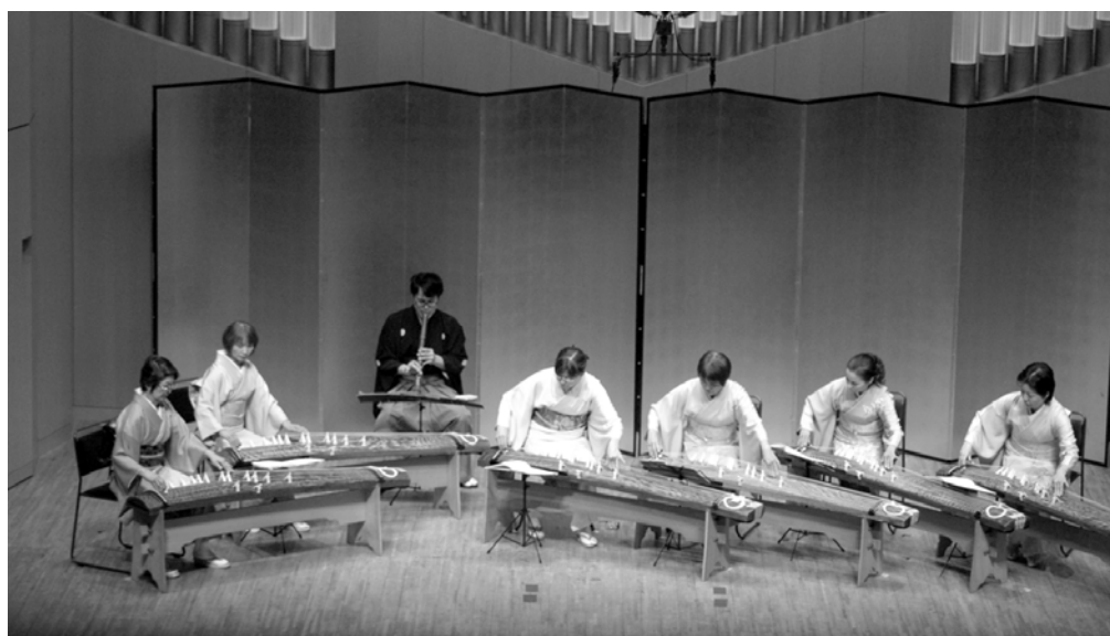
邦楽部会 発足記念コンサート 2014年3月10日 すみだトリフォニー