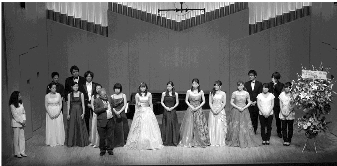
Fresh Concert 終演後の挨拶 2014年4月10日 すみだトリフォニー