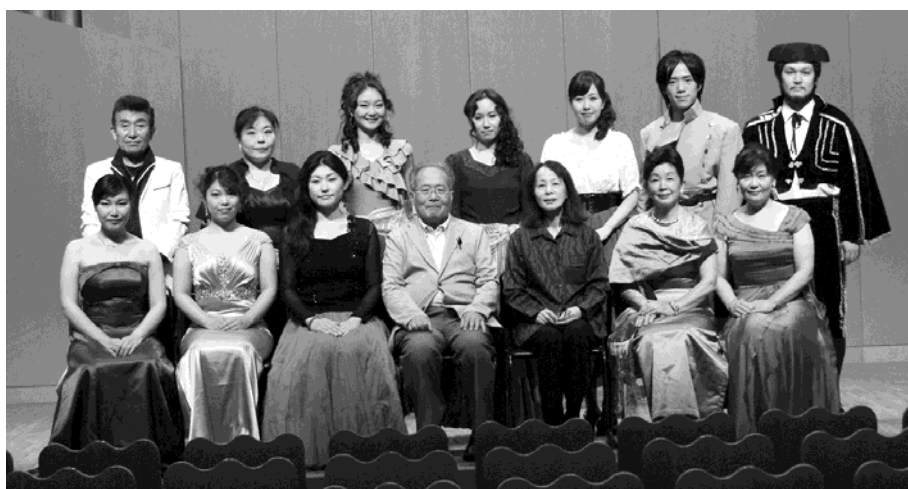
CMDI2014年オペラコンサート開演前の記念写真(9月25日)